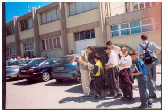
VISITA DE LA ESCUELA DE PORTEROS AL REAL MADRID. UN GRUPO DE PORTEROS SOLICITANDO UN AUTOGRAFO A CASILLAS. Abril 2003